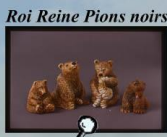
Roi Reine Pions noirs