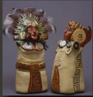
Le roi et la reine